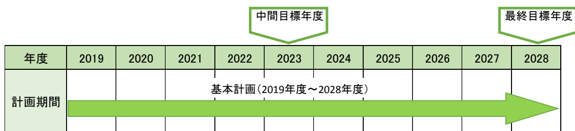
図 1 - 1 計画目標年度

また、基本計画は、概ね5年ごとに見直すものとし、中間目標年度を2023年度とします。なお、その他諸条件に大きな変動があった場合にも見直すものとします。